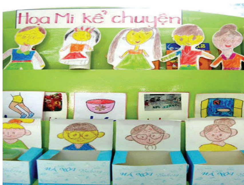
Sử dụng hộp các tông để dựng sản phẩm. Tận dụng mảng tường để tạo góc mở cho trẻ hoạt động