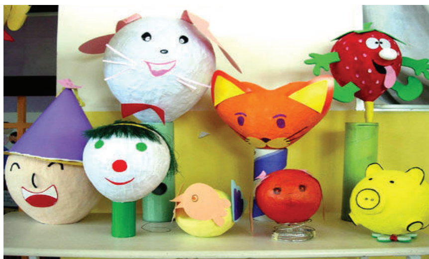
Những con rối có thể đứng được trên mặt giá để kích thích trẻ vào chơi trong góc