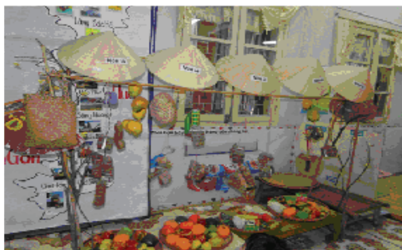
Một góc chơi bán hàng của trẻ mẫu giáo lớn được thiết kế dựa trên ý tưởng của trẻ.